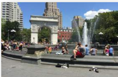
【NYU 宿舍樓下街道情景】

NYU 宿舍以華盛頓廣場為中心分散於整個下城區，不僅離學校近，生活機能方便、多采多姿的生活就在你身邊。